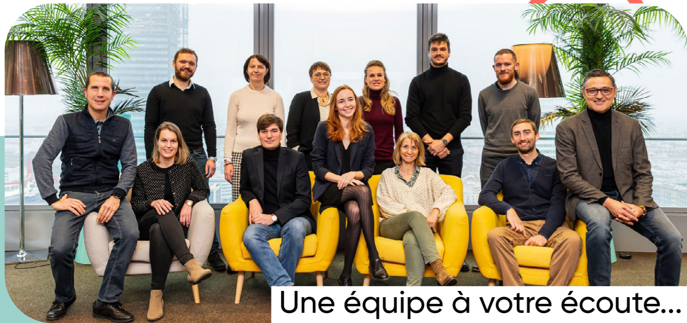
Une équipe à votre écoute...